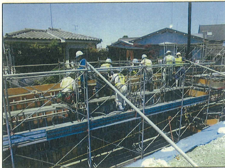
壁コンクリート打設